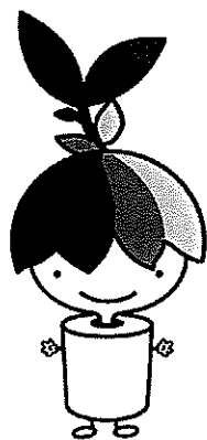
<リーフンクル> ごみ減量化・リサイクル推進マスコットキャラクター