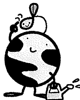
<エコたん> 福島県地球環境保全イメージキャラクター