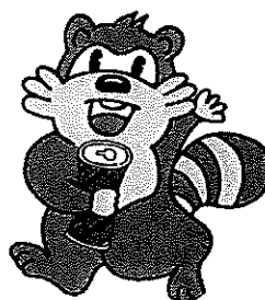
<あらいぐまのふくちゃん> クリーンふくしま運動のマスコットキャラクター