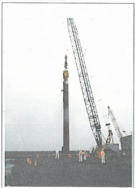
【撮影日】平成25年4月2日