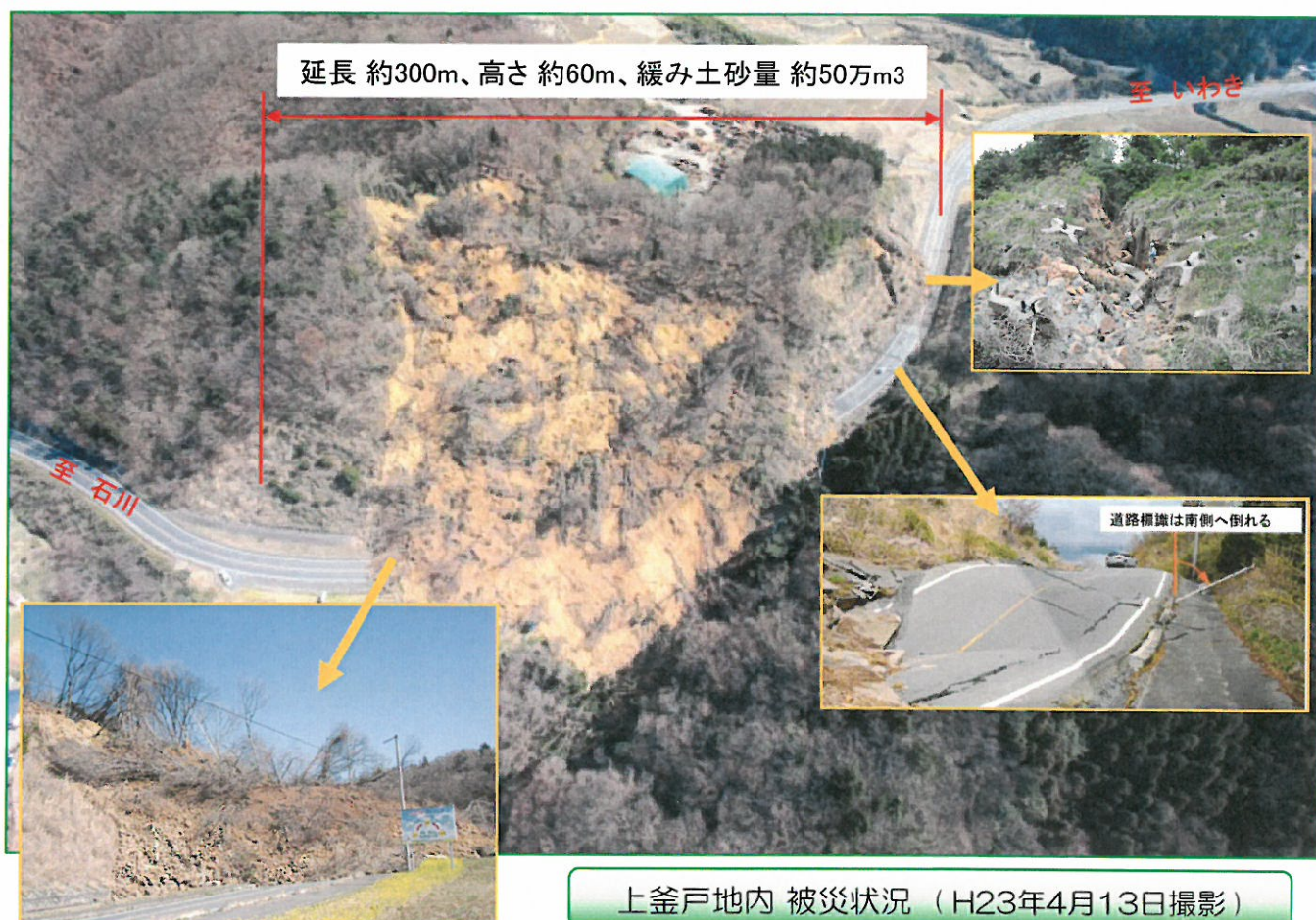
上釜戸地内 被災状況 (H23年4月13日撮影)

上釜戸地内は延長約300m高さ約60mの範囲で50万m 3 程度の土砂が尾根から道路に向かってすべり落ちたという全国的にも類を見ない大規模な地すべり災害でした。