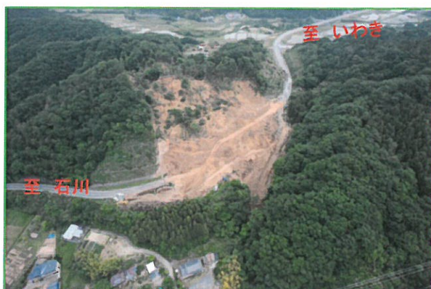
倒木処理・工事用道路完了 (5月)

最初に土砂と一緒に崩落した倒木を除去し、その後に仮道工 (延長460m) の工事に着手しましたが、山全体が不安定な状態にあったため、余震や降雨のたびに少しずつ山が動いていました。道路上に崩落した土を除去してしまうと山が大規模に動いてしまうおそれがあるため、やむを得ず崩落した土を利用して仮道工を造りました。その結果、高低差のある道路となっていますので、通行の際は安全運転をお願いします。