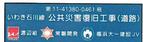
ダンプトラックの表示板

上釜戸工区は約20万m 3 の土砂を小名浜港の東港埋め立てに利活用するため、工事現場から1日当たり45台のダンプトラックで掘削土砂を運搬しています。各ダンプトラックには上釜戸工区専用の表示板を掲げています。