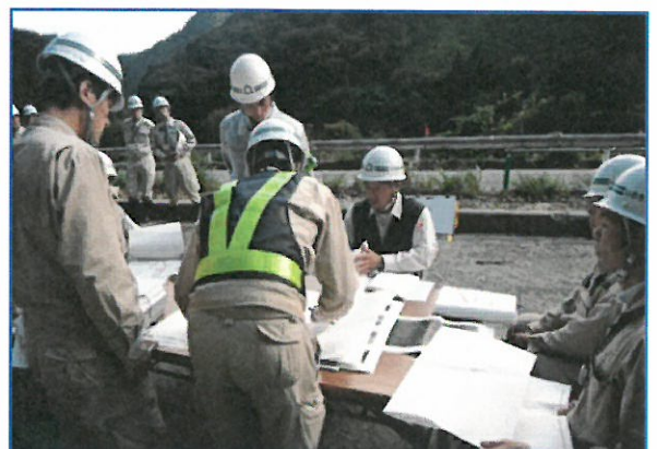
才鉢工区：査定状況