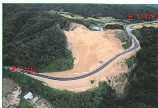
仮道工完了・通行止解除 (8月)