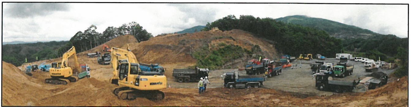
バックホウ掘削→ダンプトラックへ積込→運搬