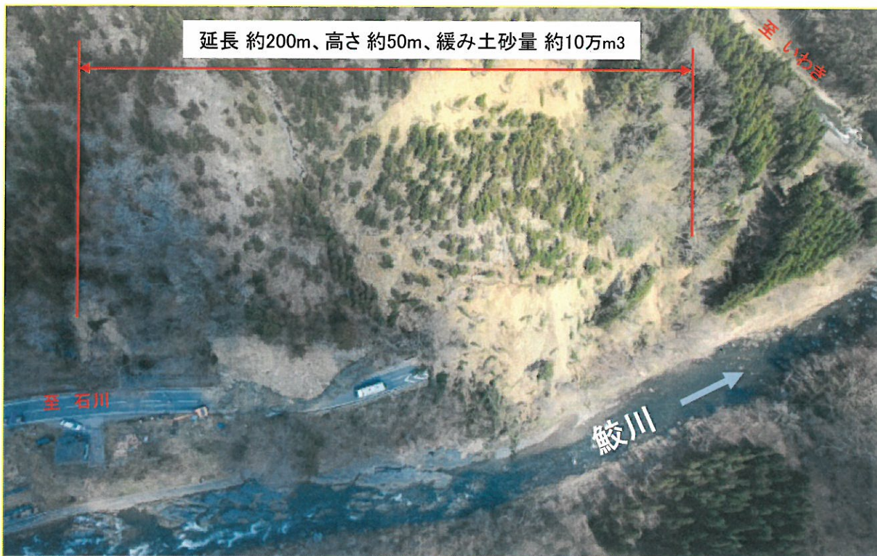
才鉢地内 被災状況 (H23年4月13日撮影)

才鉢地内の付近には井戸沢断層があり、延長約200m高さ約50mの範囲で10万m 3 程度の土砂が道路上に崩壊しました。