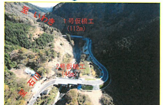
仮道工完了・通行止解除（9月）