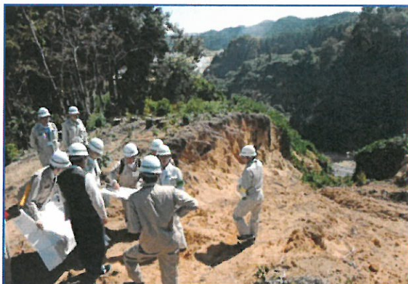
上釜戸工区：査定状況

災害が発生し復旧工事を行うためには「公共土木施設災害復旧事業費国庫負担法」に基づく各種の事務手続きが必要になります。中でも一番重要なのが災害査定ですが、上釜戸工区・才鉢工区ともに被害の規模が甚大であったため現地で災害査定（第13次査定）が行われました。