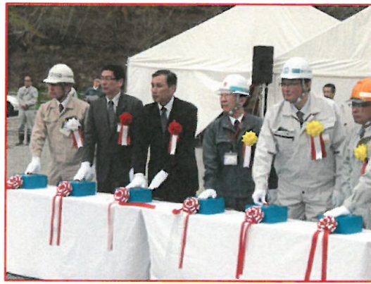
掘削開始ボタン押下