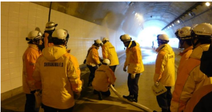
給水栓での放水 白河消防による放水