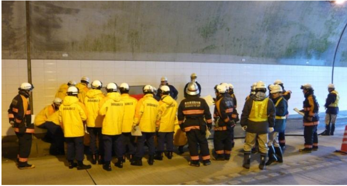
消火栓での放水 白河消防による放水