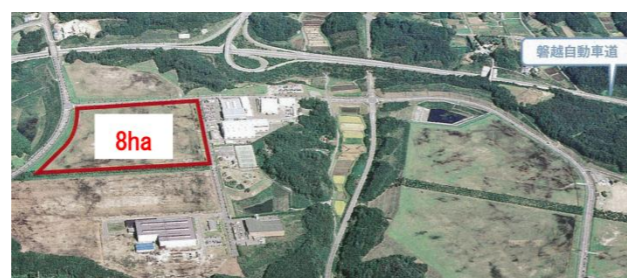
田村西部工業団地