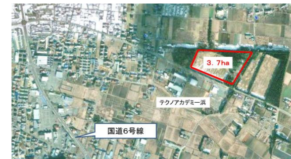
萱浜ニュースポーツ広場