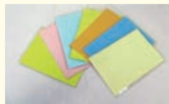
色分けされた役割カード