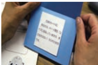
2 役割カードを読む