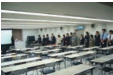
4 一列に並んで状況を聞く