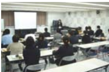
1 活動の目的とルールを聞く