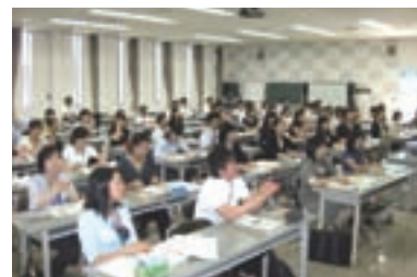
3 目を閉じて役割カードの人物を想像する