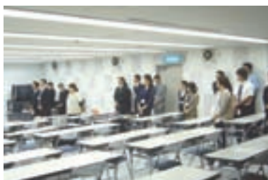
5 状況に応じて「一步前に進め」