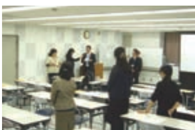
7 役割カードを紹介し気づいたことを述べる受講生