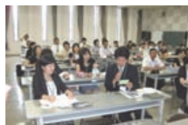
9 感じたこと、学んだことを分かち合う受講生