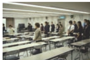
6 さらに「一步前に進め」