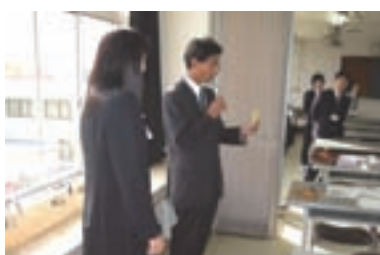
8 役割カードを紹介し、考えさせられたことを述べる受講生