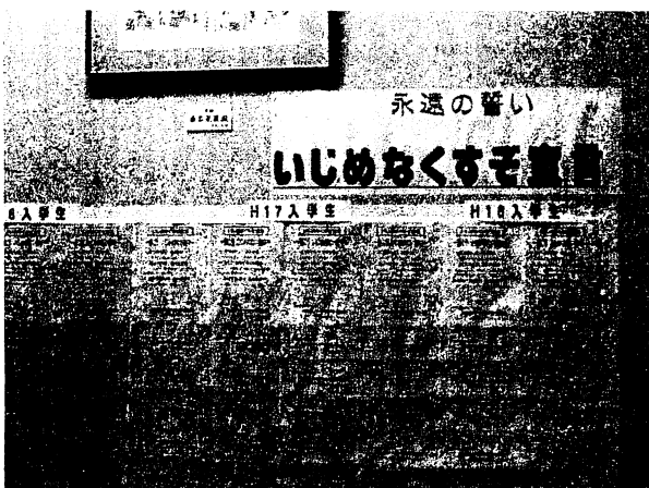
写真1 昨年度在校生の誓い