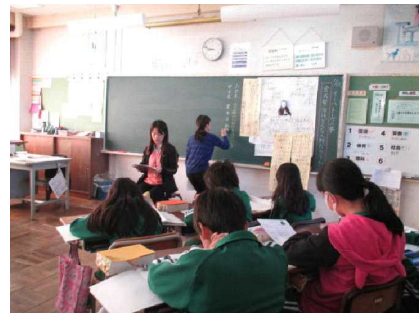
学校司書の支援で読書意欲が高まる