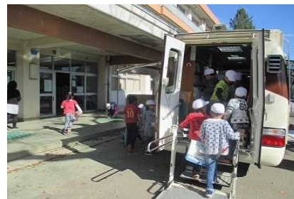
移動図書館はいつでもどこでも大人気