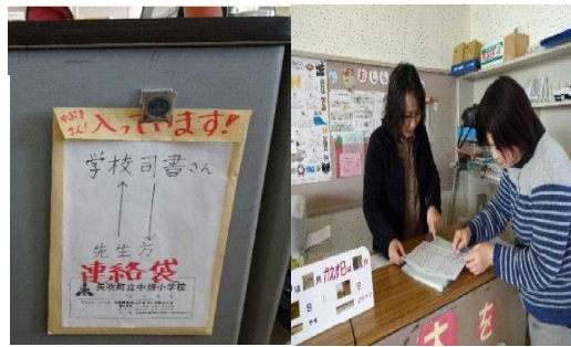
教員と学校司書の連絡袋