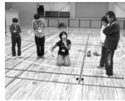
▶ディスコンをする参加者