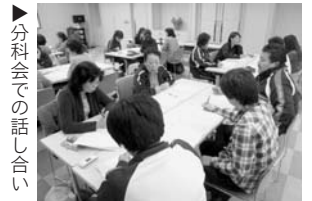
▶分科会での話し合い