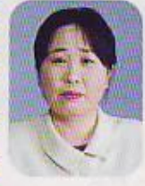
学び合いをめざして

国立公園内にある自然と調和した美しい校舎、教室から見える裏磐梯の勇姿、すばらしい自然、素直な子どもたち、温かい地域の皆様に感動しながら勤務している。新任教頭として着任し、まず入学式で地域の皆様の子どもたちへの強い思いを感じた。入学児童九名に、四十名もの来賓の皆様がご臨席くださるのである。多くの方々に支えられ、ご指導いただきながら、教頭職としてのあり方や裏磐梯の地域について学ぶ日々である。今後は地域の皆様の思いに応えるためにも、学校の中心である授業づくりを力を入れていきたいと考える。裏磐梯小学校の子どもたちのために、先生方と夢を語り合いながら、共に学び合う教師集団をめざしていきたい。