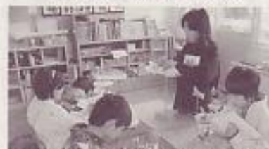
自己選択した仕組みと材料でつくる

に取り組むようになり、「先生、〇〇したいので、〇〇をください」と、一人一人が自分なりの表し方を追求していく姿が見られるようになってきた。今後、教師が今まで以上に子ども一人一人の活動をよく観察し、子ども一人一人の要求に応え、子どもの表現を後押しできるような支援を考えていきたい。