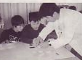
選択した多様な活動(タングラム)