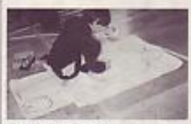
手の面積を基にして 体の表面積を求め

単元末の発展的な選択学習の時間を六十分授業とし、学年全体を4Tで指導した。単元を通して4Tで個を見取り、それぞれの思いや願いに合った活動の場を準備したことにより、どの子ども主体的に学習し、自分や友達の下さを認め合うことができた。