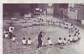
体育館で円を作り出す