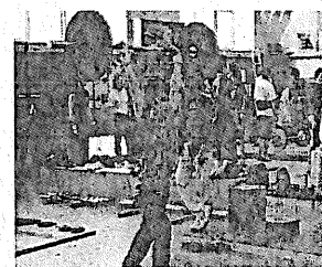
ウエイトリフティング競技の合宿の様子

本県のお家芸といわれた競技の競技力を向上させ、選手と指導者の両面を重点的に強化して、国体をはじめ多くの全国大会で上位入賞する競技者を増やし、福島のスポート環境復活の象徴とする。