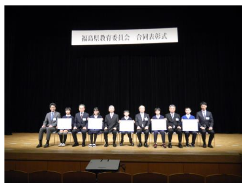
合同表彰式 平成29年1月5日 福島テルサにて

「いのち」の「かたち」は多様です。 多様というのは、さまざまだということ。 一つしかない「生命」としての「いのち」。 毎日の「生活」としての「いのち」。 あなたの「人生」とともにある「いのち」。 きみの心の「活力」としての「いのち」。 「いのち」について考えてみよう。 (『ふくしま道徳教育資料集 第Ⅰ集 生き抜く・いのち』 特別寄稿「いのちの尊重」より補足)