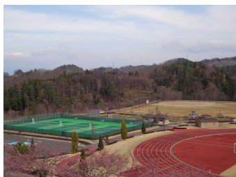
【テニスコートとソフトボール場】