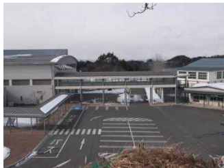
【東和小中交流ブリッジ】