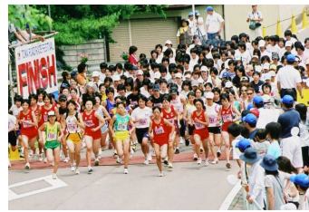
【東和ロードレース大会】