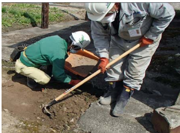
土壌剥ぎ取り作業