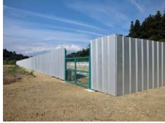
仮置場での遮へい作業