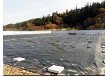
完成された仮置場