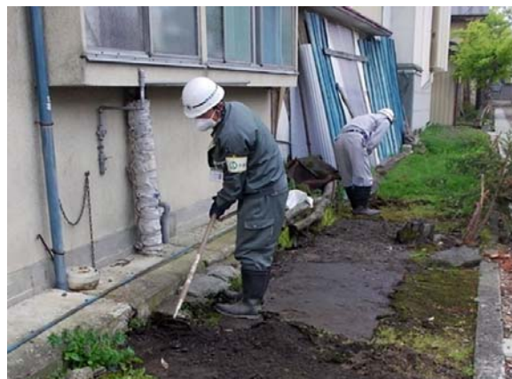
土壌剥ぎ取り作業