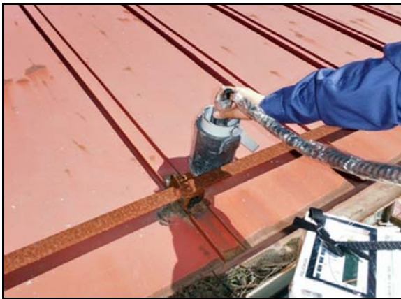
屋根の表面線量率測定