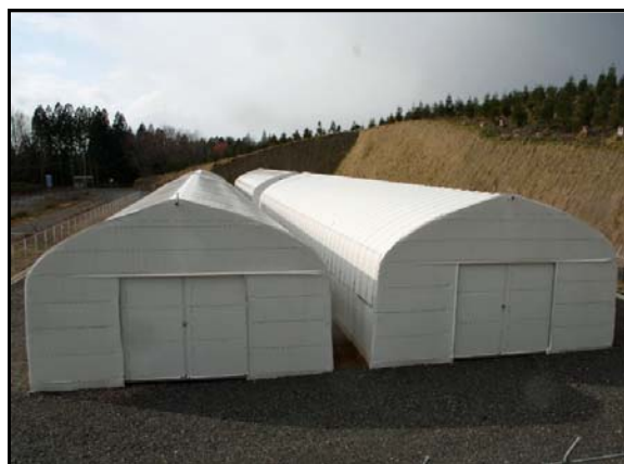
仮置場（裏側から撮影）