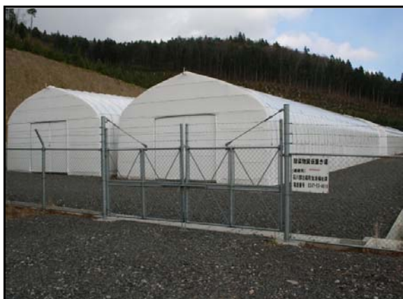
仮置場（入り口側から撮影）