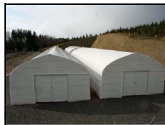
仮置場（裏側から撮影）