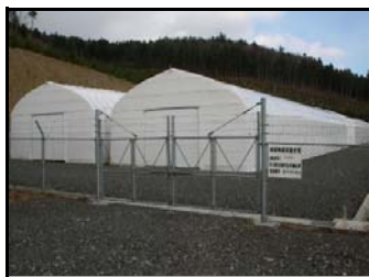
仮置場（入り口側から撮影）