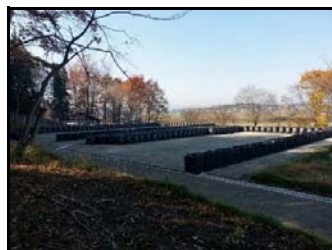
久来石地区仮置場（搬入前）