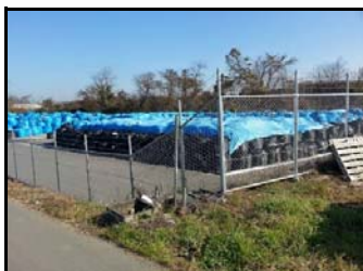
仁井田地区仮置場（搬入中）