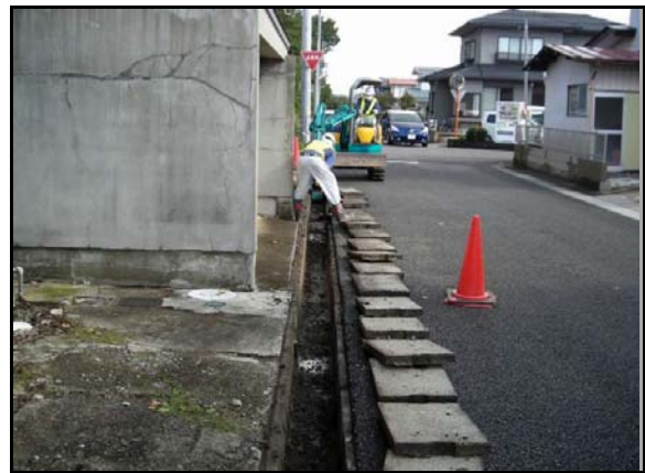
仁井田地区内側溝除染作業