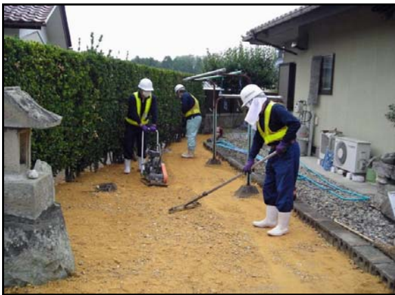
仁井田地区内住宅除染作業