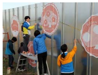
仮置場外壁にデザイン画で装飾