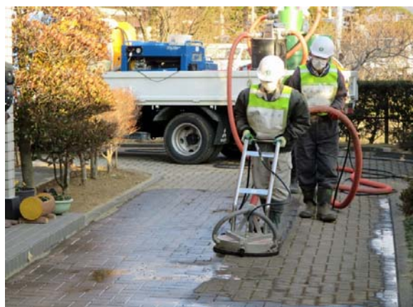
回収型高圧洗浄機による作業