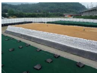
土のうで遮へいし、 遮水シートで覆う前の状況