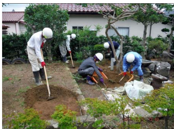
除染作業(表土除去作業)