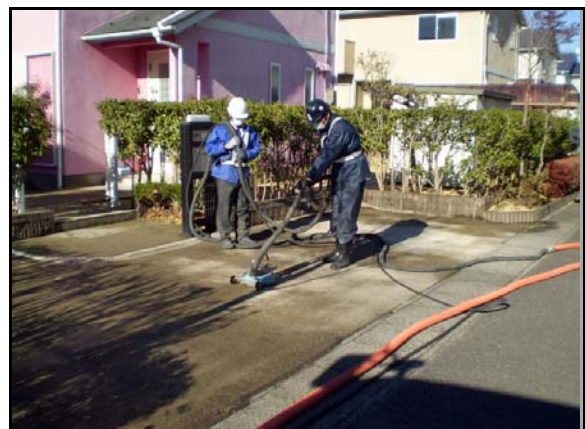
コンクリート洗浄作業