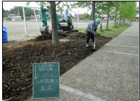
社川小学校除染状況