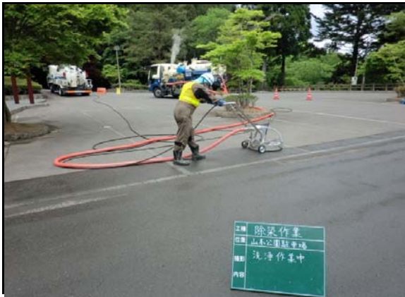
山本公園駐車場除染状況