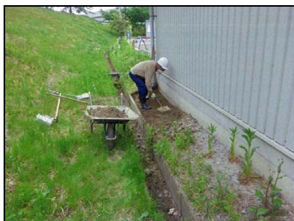
除染(表土剥ぎ取り)