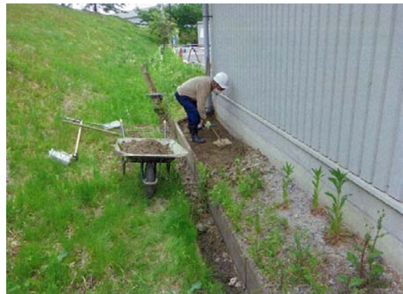
除染(表土剥ぎ取り)