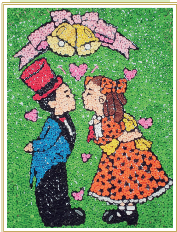
〔写真〕患者作品 患者様のリハビリの一環として、また療養の糧及び地域に根ざした活動として、当院で製作した作品です。