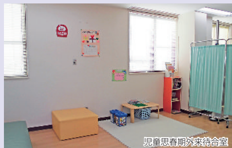
児童思春期外来待合室

一般の精神科外来とは別の専用の診察室等において、お子様がなごめるような雰囲気心がけて診療を実施しております。