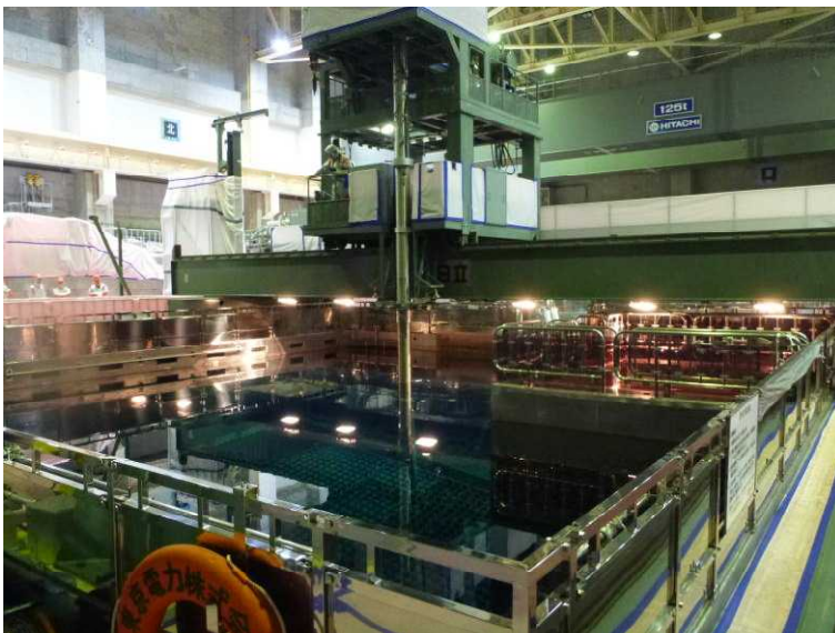
○燃料取替機による燃料 移動作業の様子