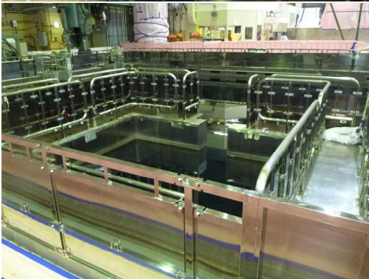
○使用済燃料プールのキャスクピット (水中で燃料貯蔵キャスクに燃料を移し替える場所)