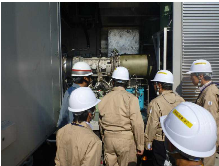
○ガスタービン発電機車エンジン部分