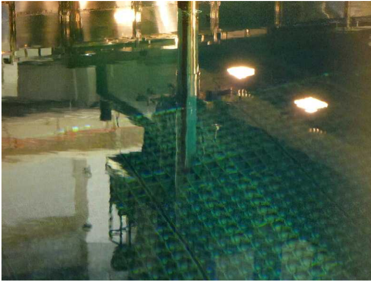
○原子炉から取り出した燃料を燃料ラックに収納