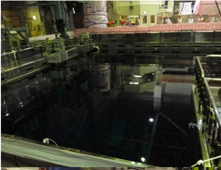
○使用済燃料プール全景