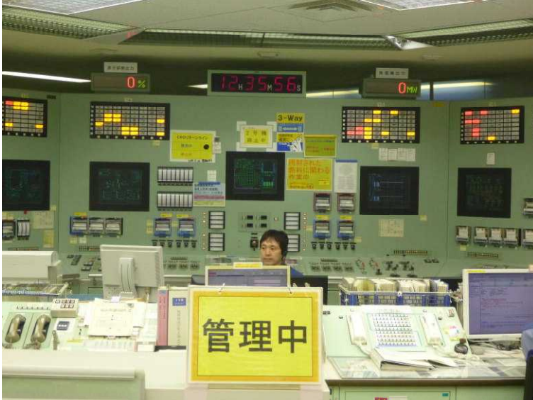
○中央操作室での燃料移動の監視状況