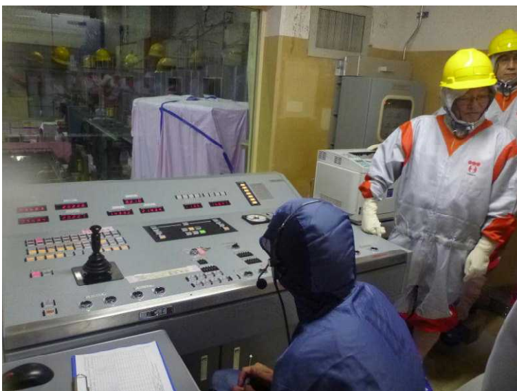
○燃料取替機操作室での作業状況