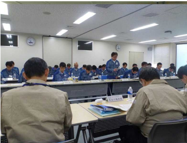
○会議 (事務本館会議室)