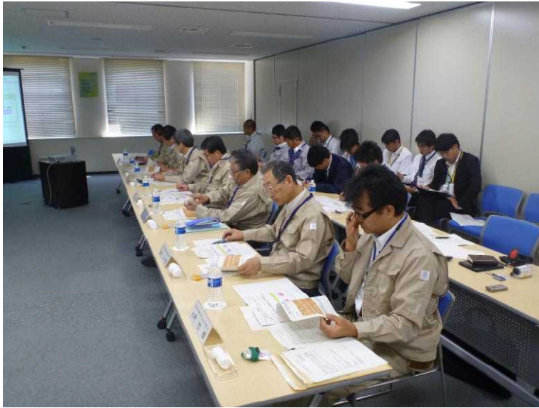
○会議 (事務本館会議室)