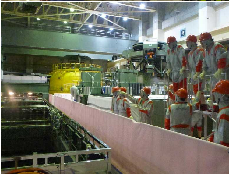
○オペレーティングフロア 全景（奥の黄色い構造物は、 原子炉格納容器の上蓋）