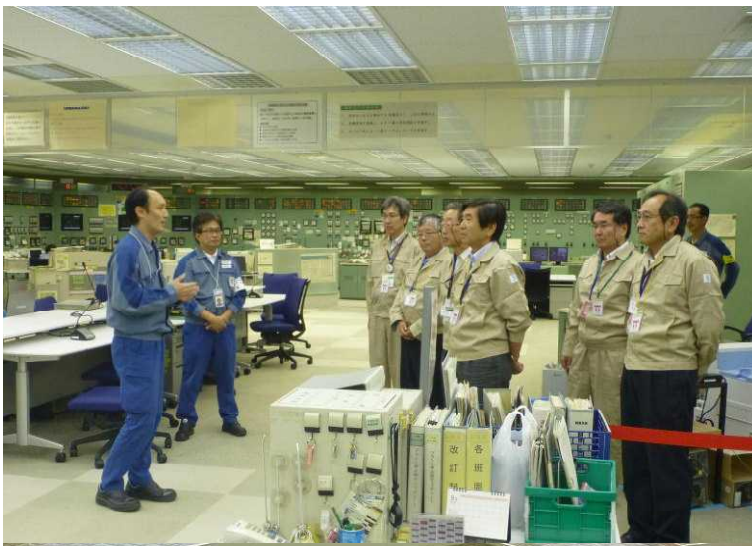
○1・2号機中央操作室