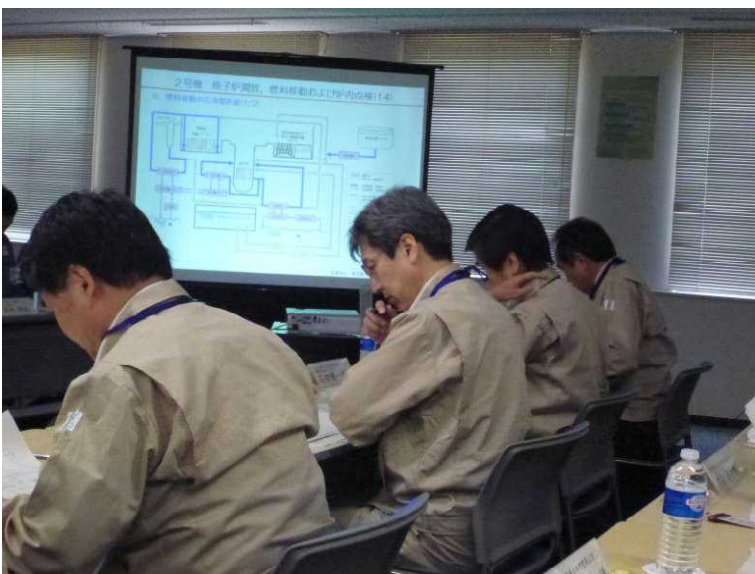
○会議 (事務本館会議室)