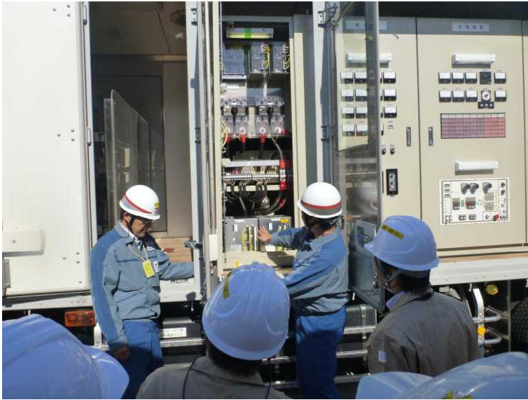
○ガスタービン発電機の充電器の取替状況確認