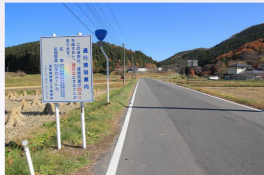
雨量による通行規制の案内表示板