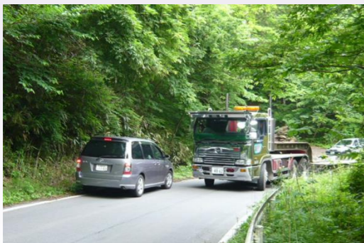
道幅が狭く大型車とのすれ違いが困難な箇所

このため、平成30年代前半の供用開始を目指し、危険箇所を避けた新たな道路として渡瀬バイパスの整備を進めています。