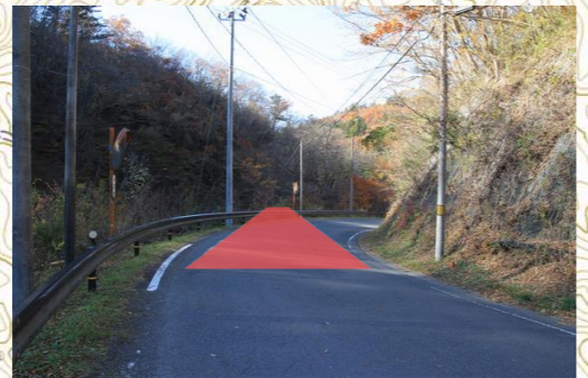
②(仮称)2号橋架橋地点