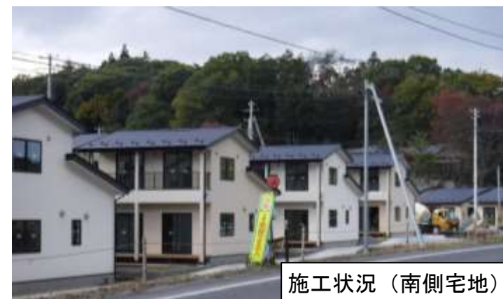
施工状況（南側宅地）