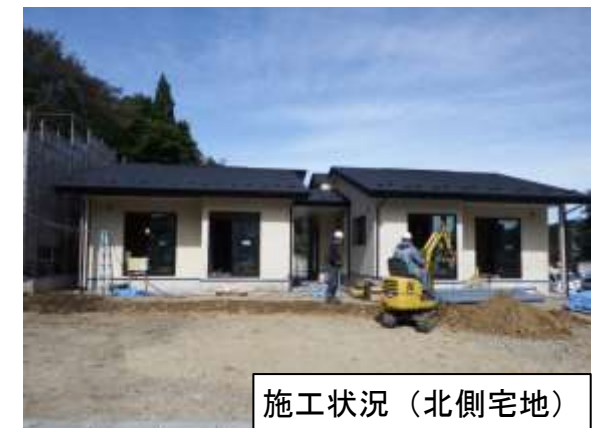
施工状況（北側宅地）