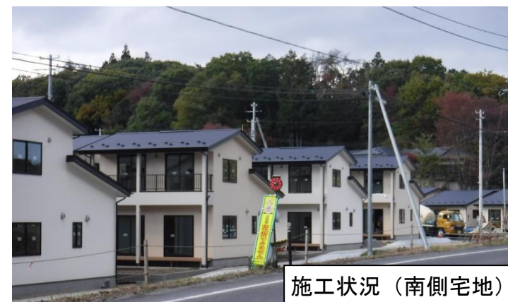
施工状況（南側宅地）