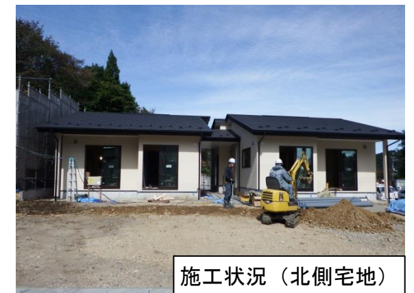
施工状況（北側宅地）