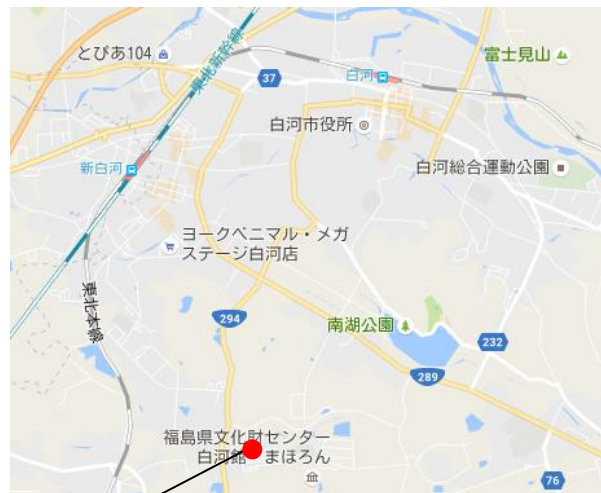
白河市白坂一里段 地内