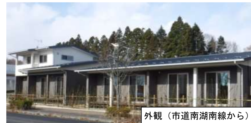
外観（市道南湖南線から）