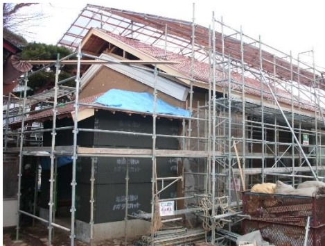
↑平成29年2月 旧脇本陣 屋根銅板葺・玄関施工時