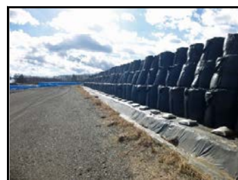
仮置場での保管の様子