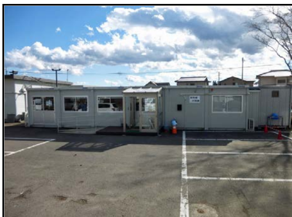
西郷村放射能対策課事務室