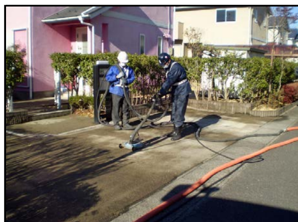
コンクリート洗浄作業