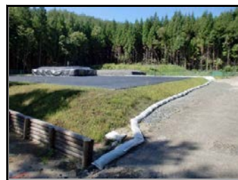
手前: 2号(不燃物)置場 奥: 3号(可燃)置場