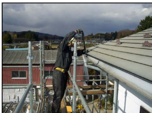
縦樋除染作業状況