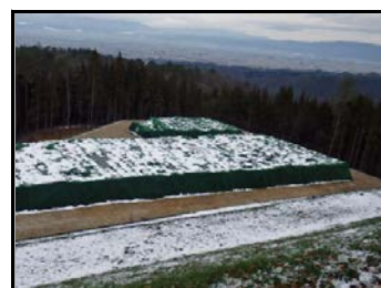
完成された仮置場