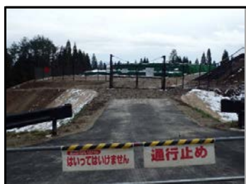
仮置場での遮へい作業