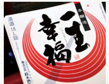
虹の町長井をモチーフにした新しいラベル