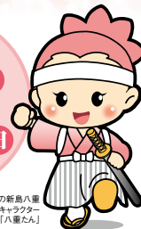
福島県の新島八重 マスコットキャラクター 「八重たん」