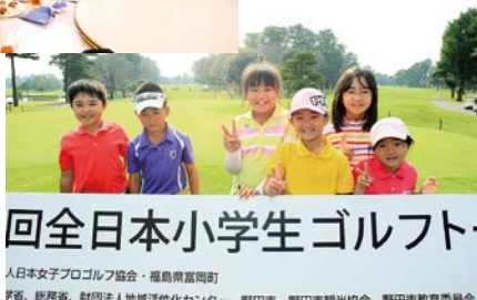
回全日本小学生ゴルフ 人日本女子プロゴルフ協会・福島県富岡町 取材協力 地域活性化センター

大会概要 日程 10月6日(土)開会式 10月7日(日)競技・表彰式 場所 千葉カントリークラブ 川間コース 千葉県野田市中里 3477