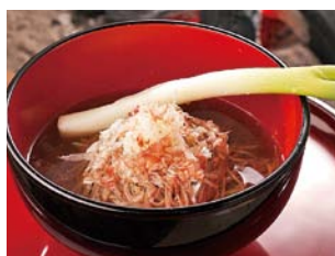
ネギで食べる蕎麦

大内宿では、箸の代わりにネギで食べる蕎麦などの食事だけでなく、郷土工芸品や地元の野菜などの買い物も楽しめます。また、そば打ち体験や民俗資料の展示館などもおすすめ。(駅から車で約15分)