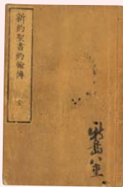
八重旧蔵「新約聖書ヨハネ伝」(同志社史資料センター蔵)