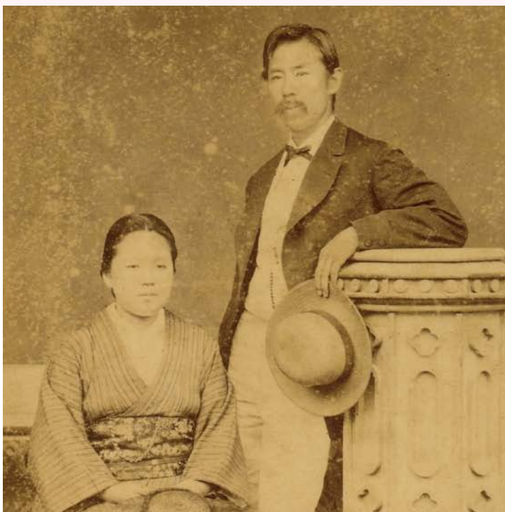
結婚したばかりの襄と八重

会津藩出身の女丈夫「新島 八重」 NHK大河ドラマで描かれる八重をクローズアップする本連載。 連載5回目は、新島襄と八重の運命が交錯する京都時代を描く。