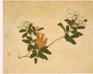
八重遺品「手芸品」(同志社史資料センター蔵)