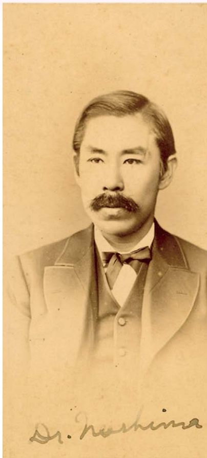
新島 襄