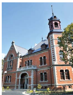
クラーク記念館