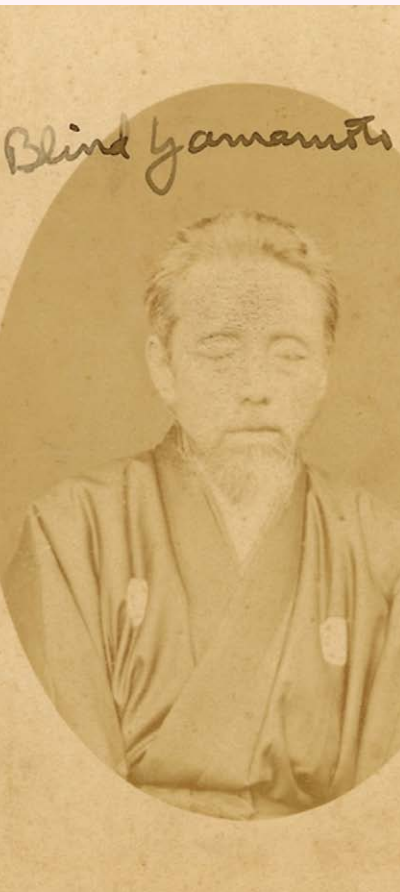
山本 覚馬