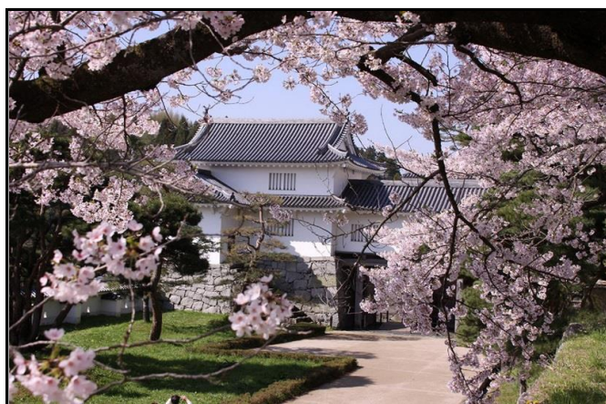
霞ヶ城公園 箕輪門