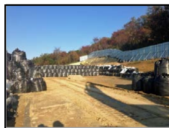
郡山市日和田町高倉地内の 仮置場整地作業