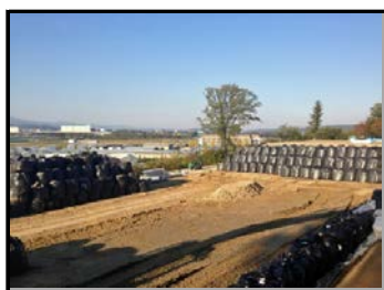
郡山市日和田町高倉地内の 仮置場整地作業