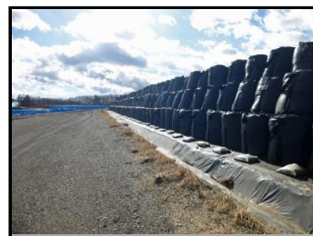
仮置場での保管の様子