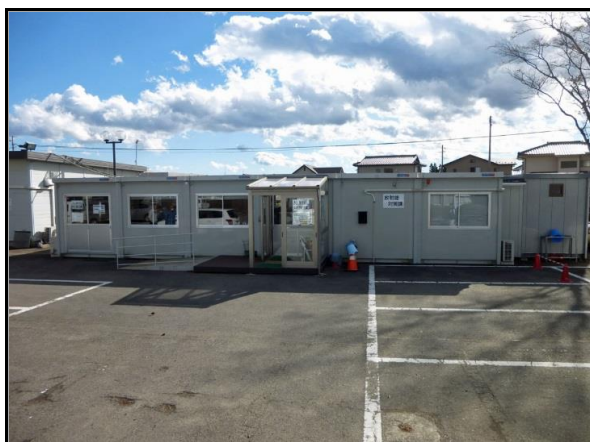
西郷村放射能対策課事務室