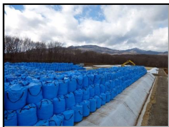
仮置場造成の様子