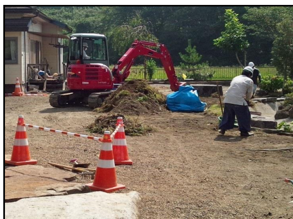
住宅敷地内の除染作業