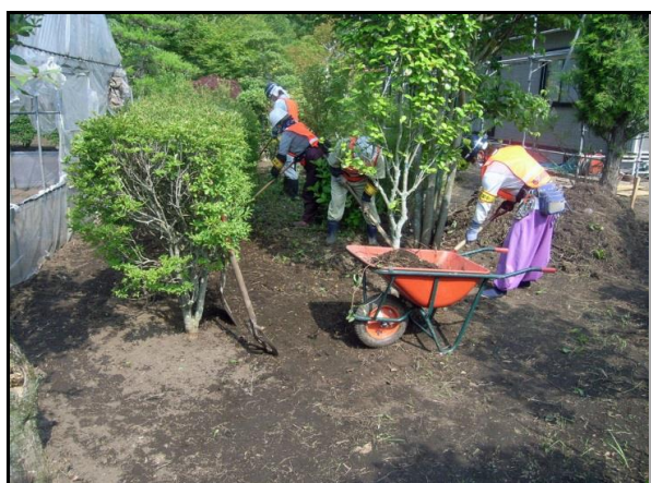
汚染土壌剥ぎ取り作業