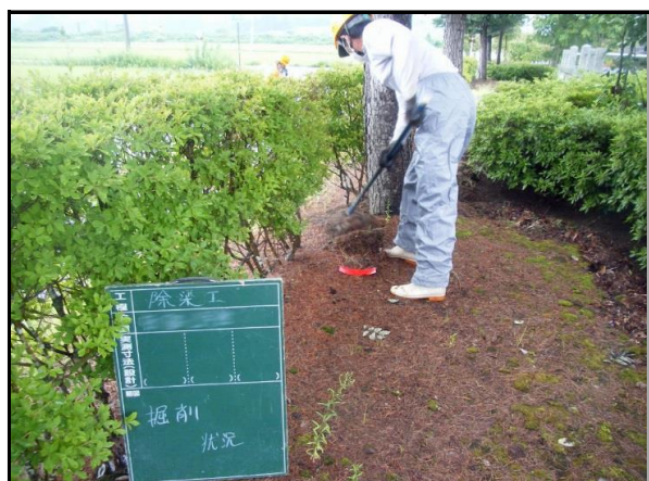
役場周辺除染(表土の剥ぎ取り)