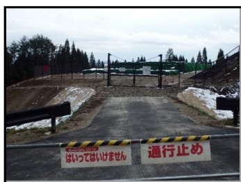
仮置場での遮へい作業