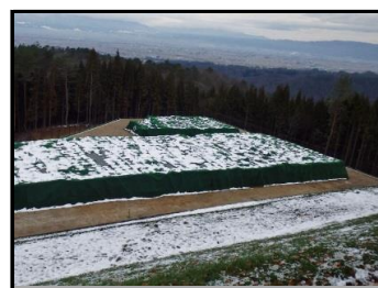
完成された仮置場