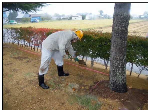
役場周辺除染(客土)