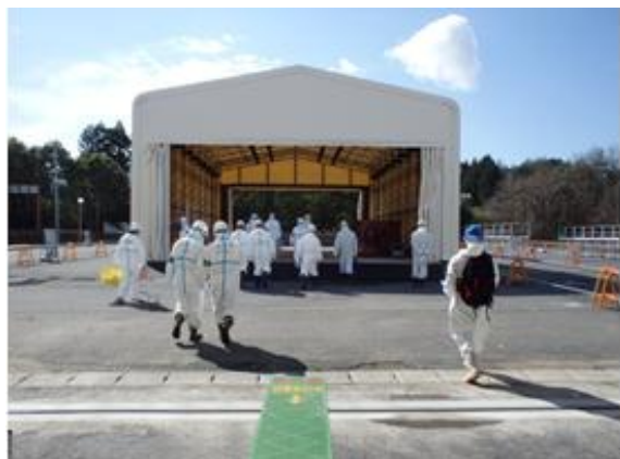
スクリーニング場の確認