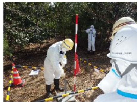
地下水観測井の確認