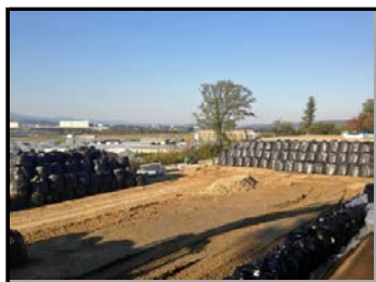
郡山市日和田町高倉地内の 仮置場整地作業