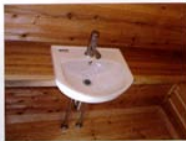
伊達市 手洗カウンター