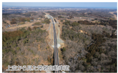
新たに開通した区間 常磐富岡IC～浪江IC間