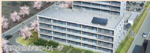
復興公営住宅のイメージ

復興公営住宅の整備について、あらゆる手段を講じて整備期間の短縮を図り、一日も早い入居を目指します。また、住居の再建や改修などの支援に対しても引き続き力を入れていきます。