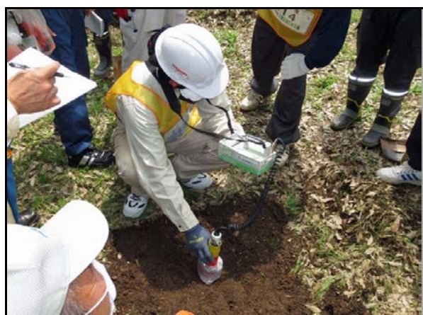
コリメータ使用し線量確認