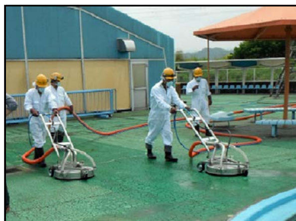
同時吸引型高圧洗浄実施