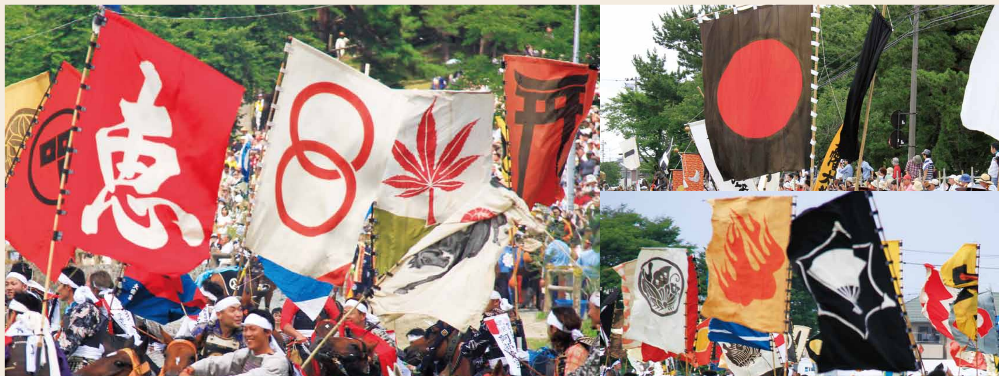
色鮮やかなものや凝った絵柄など、さまざまな旗印が並ぶ

問い合わせはこちら 相馬野馬追執行委員会事務局 ☎ 0244-22-3064 http://soma-nomaoui.jp