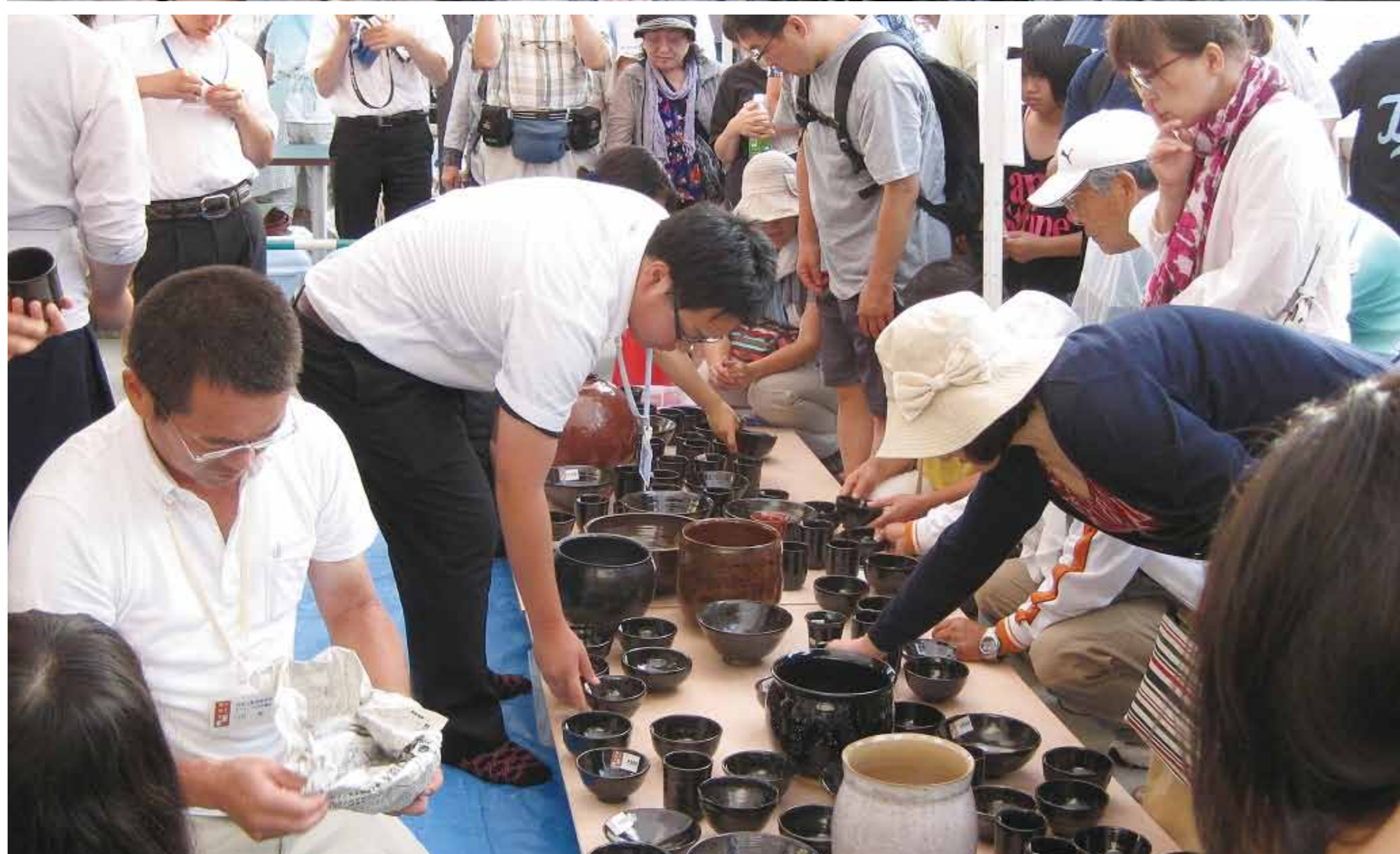
早朝4:00から12:00まで開催。交渉次第で、よりお得に購入できるかもしれません