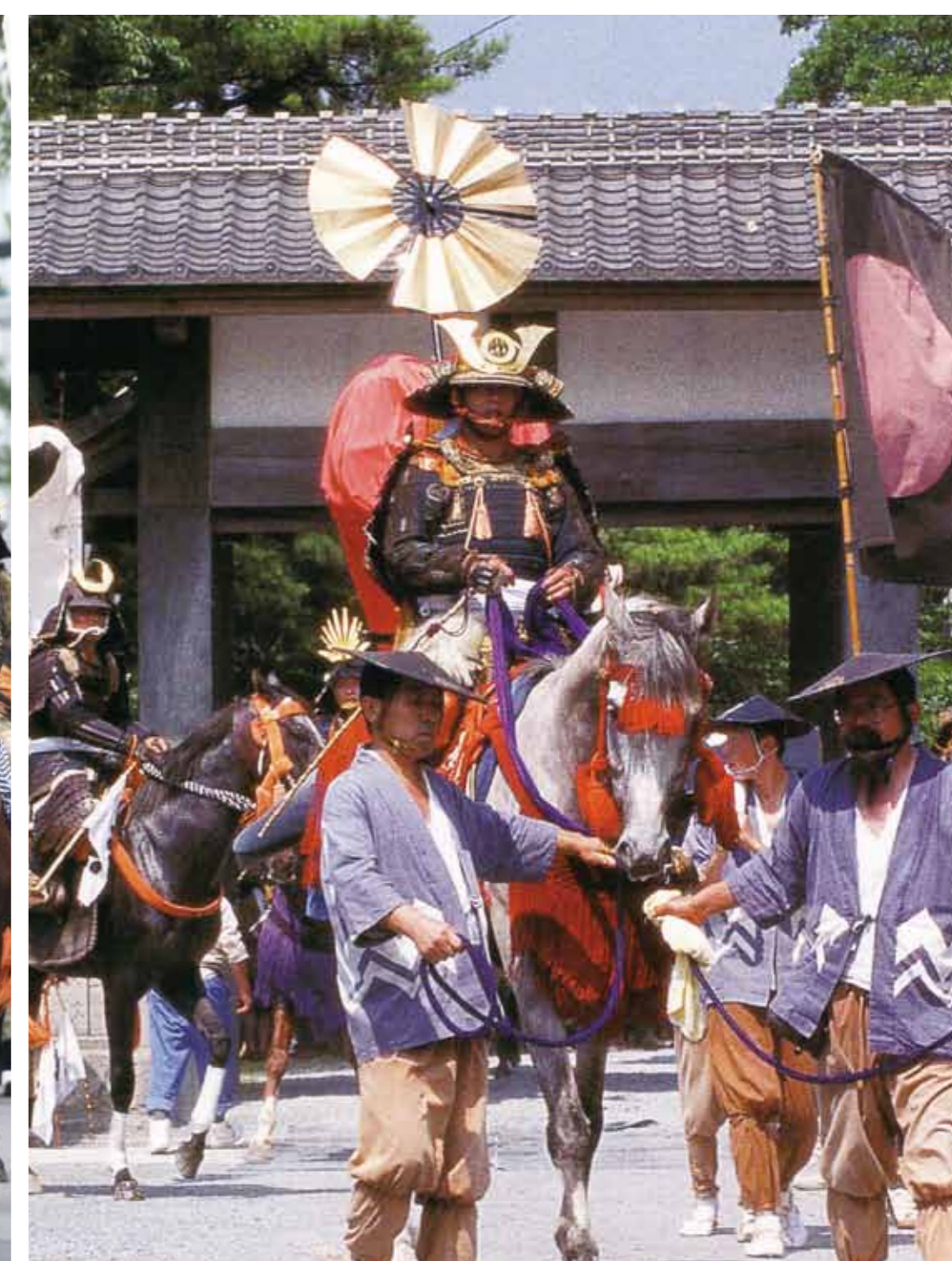
総大将相馬氏の出陣