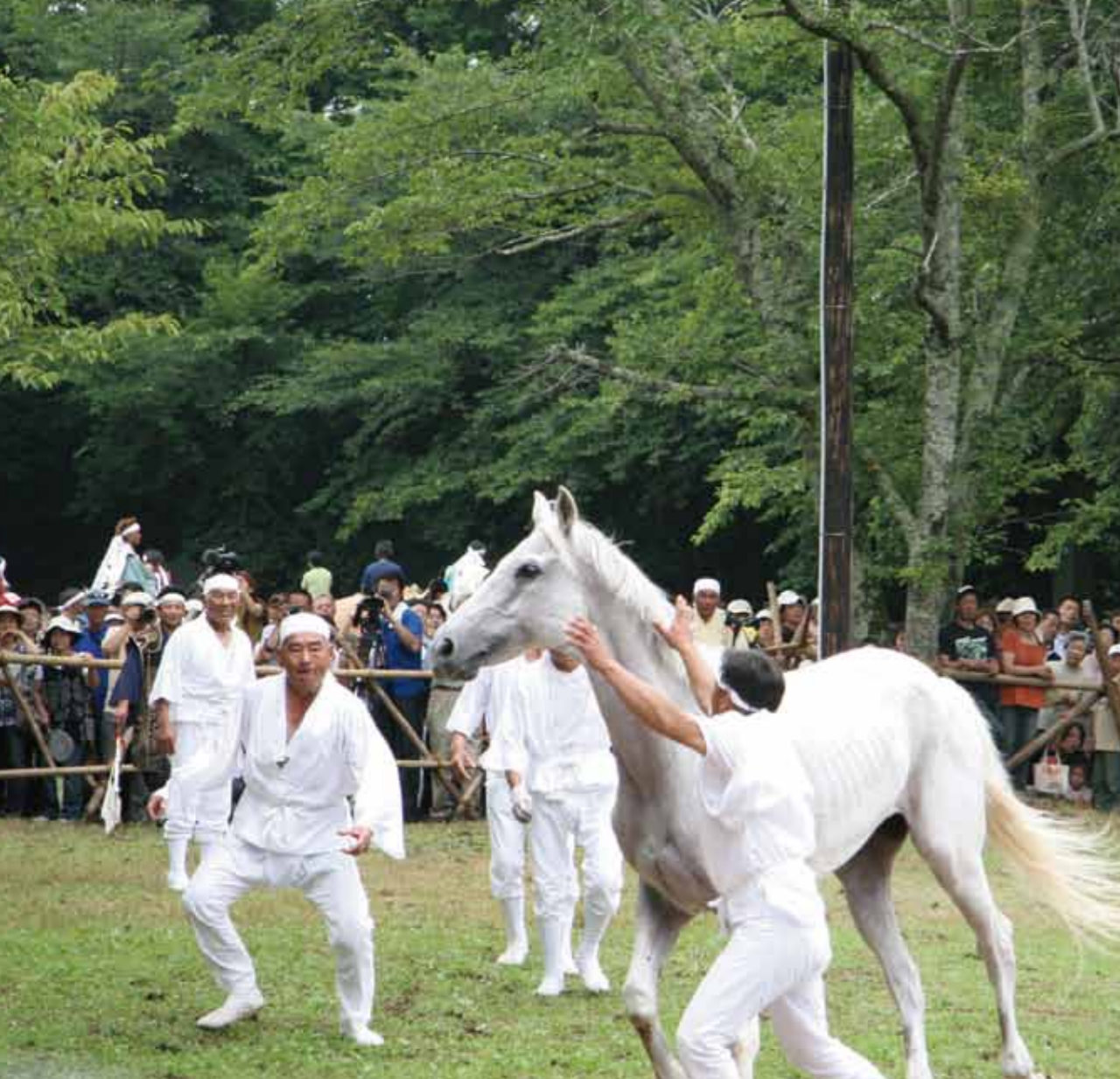
昔から変わらない形で受け継がれている のまかけ 神事「野馬懸」