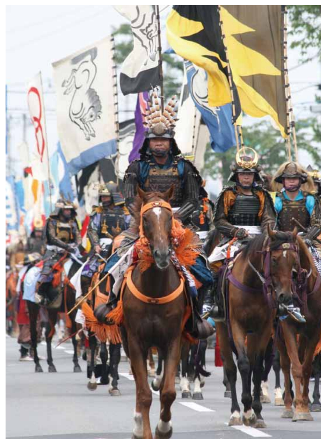
威風堂々と進む「お行列」