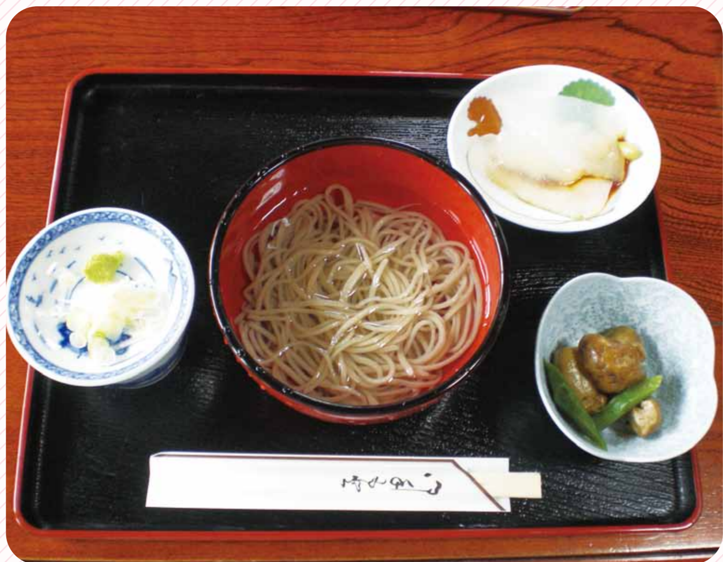
そばの究極の食べ方「水そば」

日本有数のそばの名産地、山都町。つなぎを全く使わずそば粉だけで作られるそばは、通もうならせるほどです。中でも宮古地区で提供している「水そば」は、そばの甘み、喉越しを水だけで楽しむという究極の食べ方。そば好きなら一度は食してほしい逸品です。