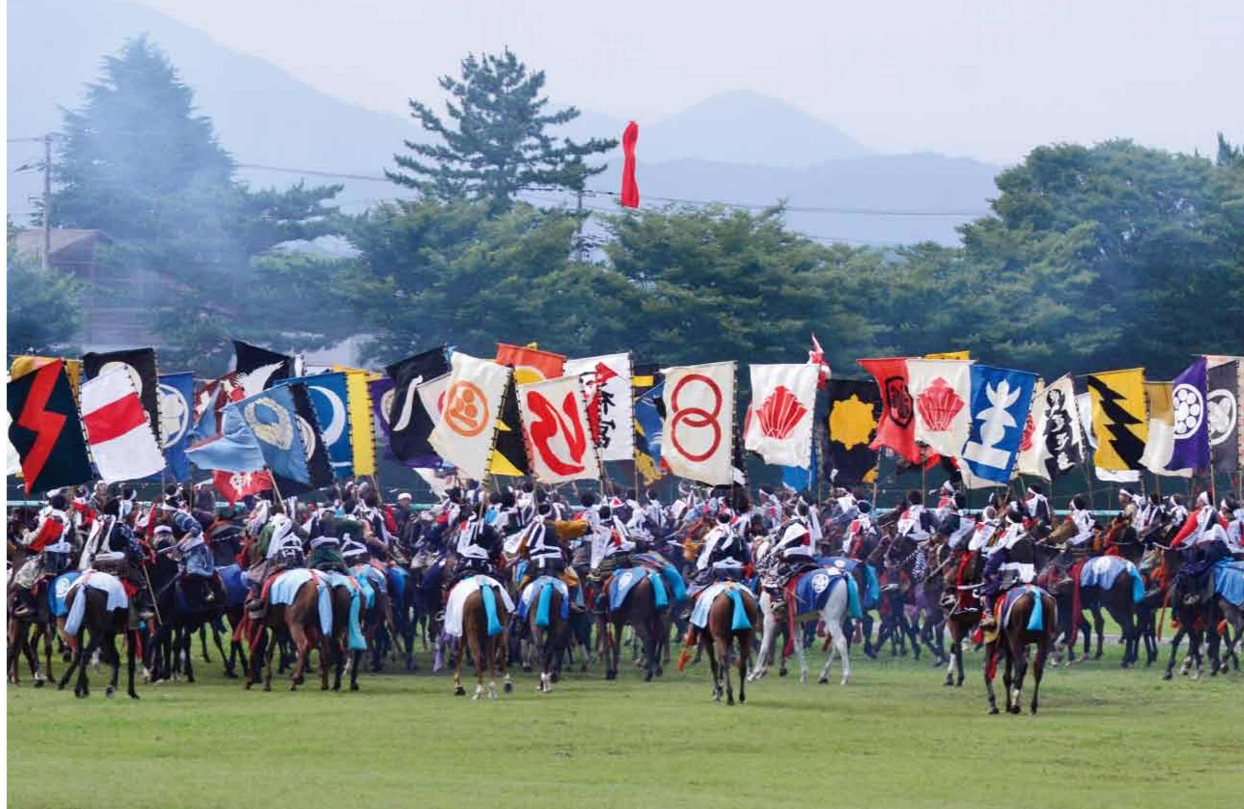
しんきそうだつせん 総勢500騎が打ち上げられた御神旗を奪い合う「神旗争奪戦」