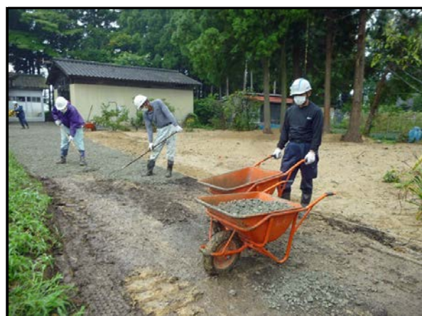
住宅除染実施状況