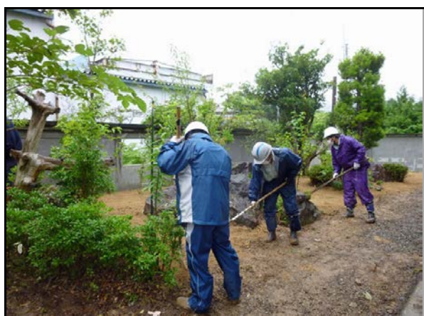
住宅除染実施状況